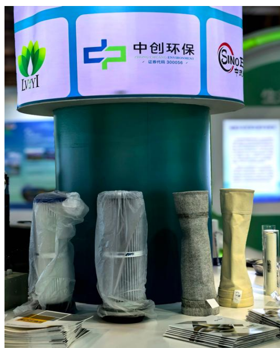
中创滤料产品广受关注 2