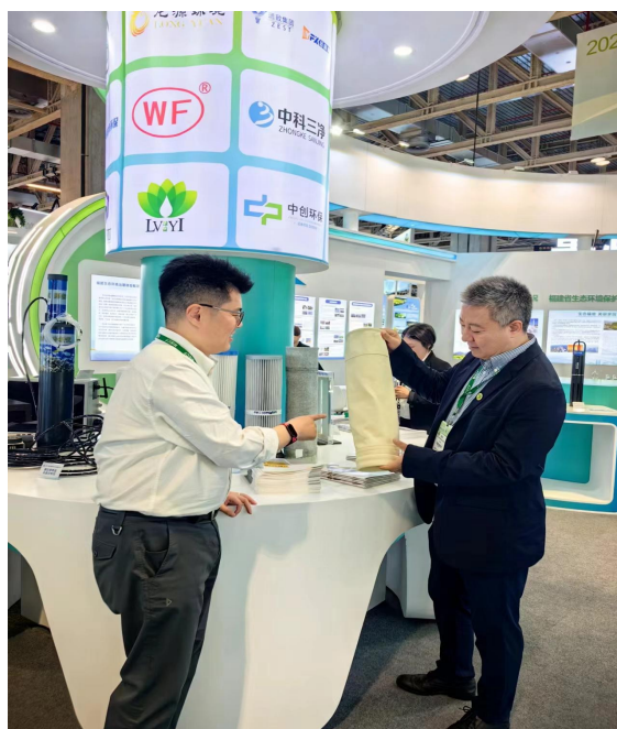
中创滤料产品广受关注

此次中创滤料参展产品为针对电力、钢铁、建材等行业超低排放的各类滤料，包括水刺工艺滤袋、滤筒等最新研发应用产品，鉴于日益严峻的大气排放标准以及大气污染治理的需求，我司产品吸引了包括媒体、海内外客商、各省市环保协会以及环保企业的广泛关注。