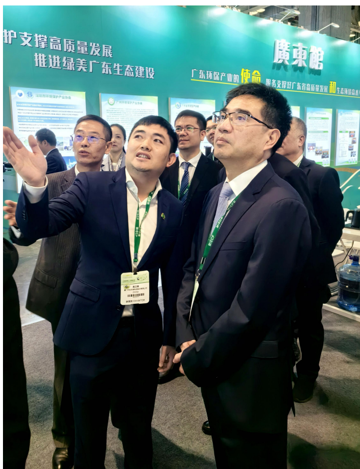
福建省副省长林文斌莅临我司展台并听取汇报

开幕前，福建省副省长林文斌到福建展馆，了解福建参展企业发展情况，详细听取了我司在产品技术研发及核心优势、实验室建设、中创滤料在超低排放领域的贡献等方面的汇报，并寄希望本土环保企业在生态环境治理中发挥更大的作用与影响力。